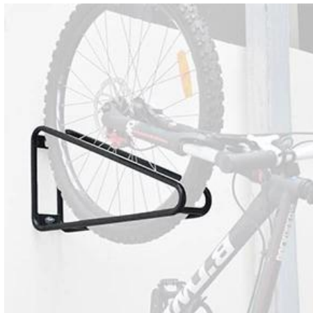
Supporto da parete per portabiciclette